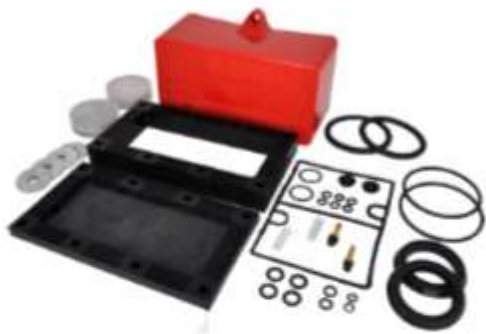
Стандартные изделия (заказываются отдельно) 1. Винт М6-6х40.56 ГОСТ 17475-80 - 8шт

9. Крышка глушитель У7124А-00-411 = 1 шт.